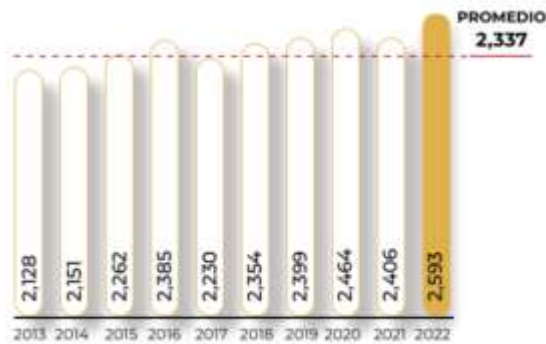
Gráfico 1. Volumen de la producción nacional 2013-2022 (miles de toneladas).

Fuente: imagen tomada de SAGARPA. (2017). Plan Nacional agrícola 2017-2030.