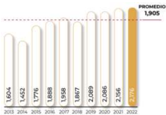
Gráfico 1. Volumen de producción nacional 2013-2022 (miles de toneladas).

Fuente: imagen tomada de SAGARPA (2017) Panorama Agroalimentario 2017-2030.