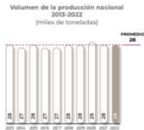
Cuadro 1. Volumen de la producción nacional 2013-2022 (Miles de toneladas)

Fuente: Imagen tomada de Sagarpa, (2017) Plan Nacional agrícola 2017-2030.