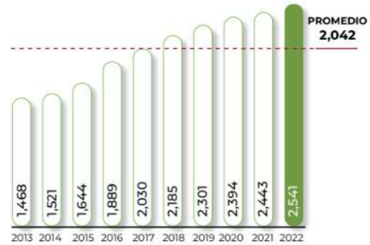
Gráfico 1. Volumen de producción nacional 2013-2022 (miles de toneladas).

Fuente: imagen tomada de SAGARPA (2017) Panorama Agroalimentario 2017-2030.