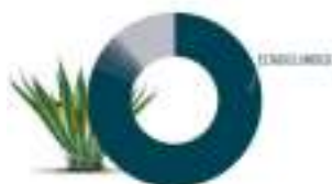
Gráfica 1. Destinos de exportación de Tequila.

México se encuentra en primer lugar como exportador de estas bebidas espirituosas, muy por encima de Corea del Sur, su segundo competidor, superándolo en un 118%. Ahora bien, con base en el crecimiento de la demanda comercial en los potenciales socios comerciales de nuestro país, nos encontramos con una mayor oportunidad de exportar (Ver Gráfica 3 y Cuadro 2).