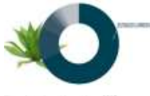
Cuadro 1. Distribución de la disponibilidad de Tequila y Mezcal en México (Miles de litros)